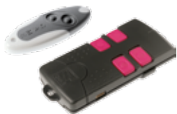
TAM-432SA • T438

Передатчики Атомо используют технологию динамического кода, который меняется при каждом сигнале, обеспечивая абсолютную безопасность и секретность исходящего радиосигнала. Для обеспечения еще большей безопасности в Атомо предусмотрено 4294967896 возможных кодовых комбинаций. Серия представлена 2-канальными и 4-канальными версиями.