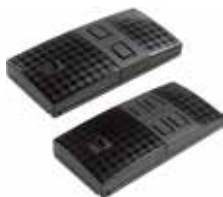
TWIN2 • TWIN4

Передатчики для управления несколькими системами доступа в частных жилых домах и кондоминиумах. Серия представлена 2-канальными и 8-канальными устройствами, оснащенными функцией автоматического определения кода от передатчика к передатчику.