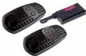
TOP-432EV • TOP-434EV • TOP-432S