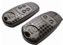
AT02 • AT04

Эти 2-канальные, 4-канальные ибредлоки - передатчики для управления несколькими системами доступа широко используются для управления автоматикой в жилом секторе. В моделях TOP-432EV и TOP-434EV предусмотрено 4096 кодовых комбинаций. Кроме того, передатчики оснащены функцией автоматического определения кода при его передаче от одного устройства к другому.