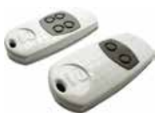
TOP-862EV • TOP-864EV

Технология Key Code позволяет устанавливать пароль доступа к программированию передатчика, что дает возможность контролировать использование функции автоматического определения кода от передатчика к передатчику, препятствуя созданию неавторизованных дубликатов. 2-канальные и 4-канальные передатчики Твин располагают 4294967896 кодовыми комбинациями. Они могут быть также оснащены специальным TAG-транспондером, который позволяет совмещать несколько функций в одном устройстве.